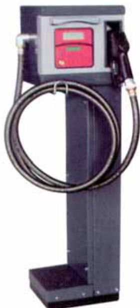
PF-594 med stativ PA-9360