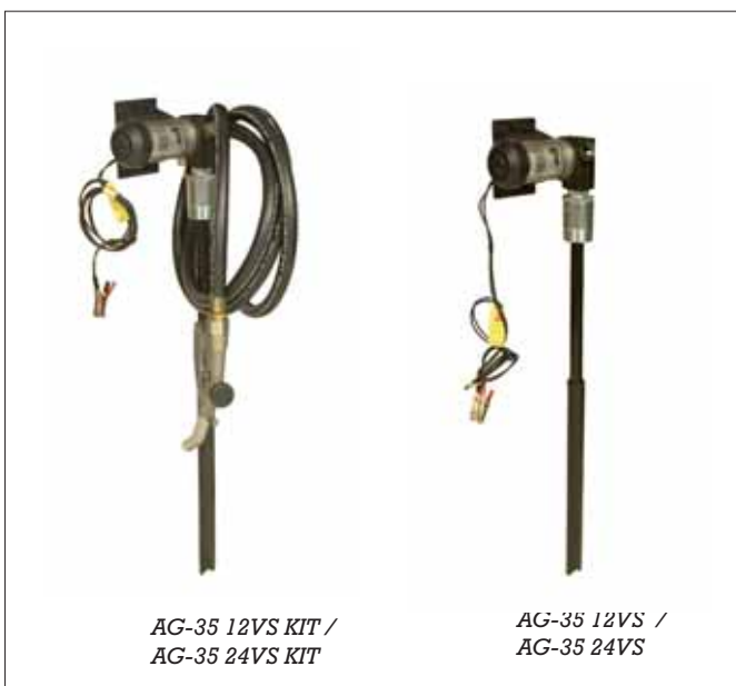
AG-35 12VS KIT / AG-35 24VS KIT