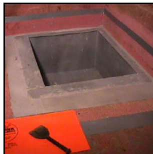
Invallningen upplagd och klar att belägga