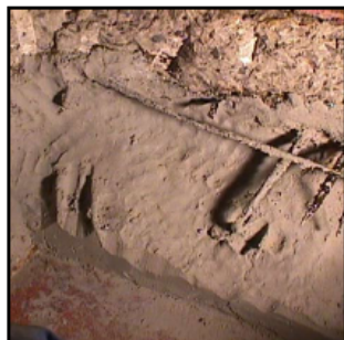
Belzona® reparerar skadorna med betong