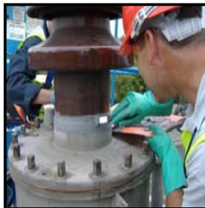
Applicering av Belzona® 1831