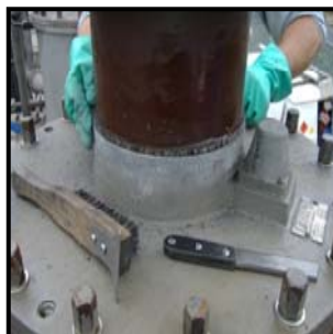
Preparering av ytan som skall beläggas